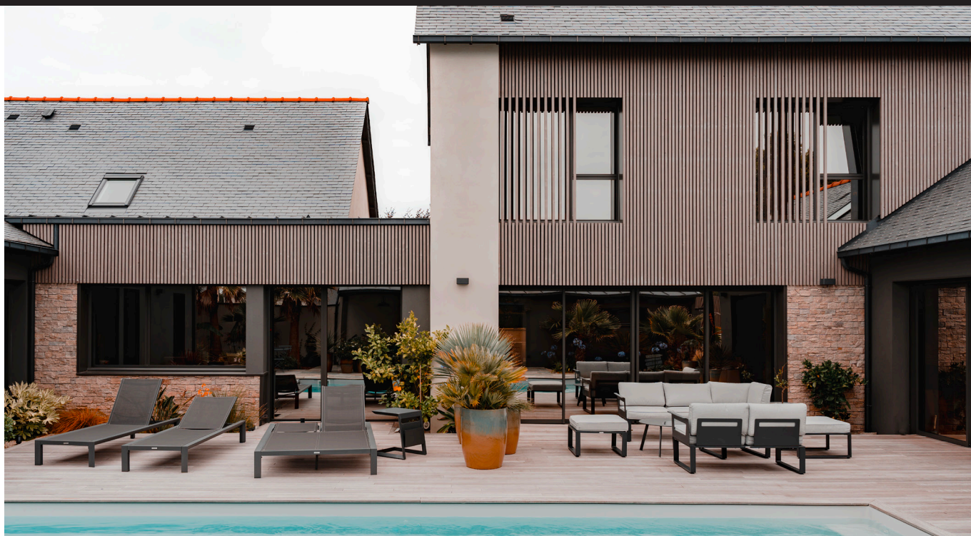
Bardage Essentiel, Profil Quadri 40x40, Coloris Silver - ©M&TY.

Spécialiste des produits bois pour l'habitat et l'extérieur (bardage, lambris, terrasse, clôture et bois de construction), PROTAC présente ESSENTIEL , une gamme en bois saturé conçue à partir d'épicéas issus de forêts scandinaves et également disponible en Douglas issus de forêts Françaises gérées durablement, certifiée PEFC et FSC. De haute qualité, cette offre procure une pérennité exceptionnelle à tous les projets extérieurs. L'apparence translucide de la saturation, garantie 5 ans de la finition sur l'épicéa, laisse apparaître le veinage naturel du bois pour apporter une authenticité et une esthétique intemporelle à chaque réalisation.