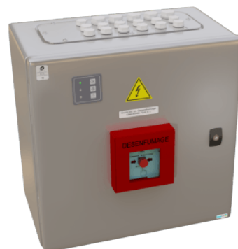
Coffret Astérion 24V / 48V.