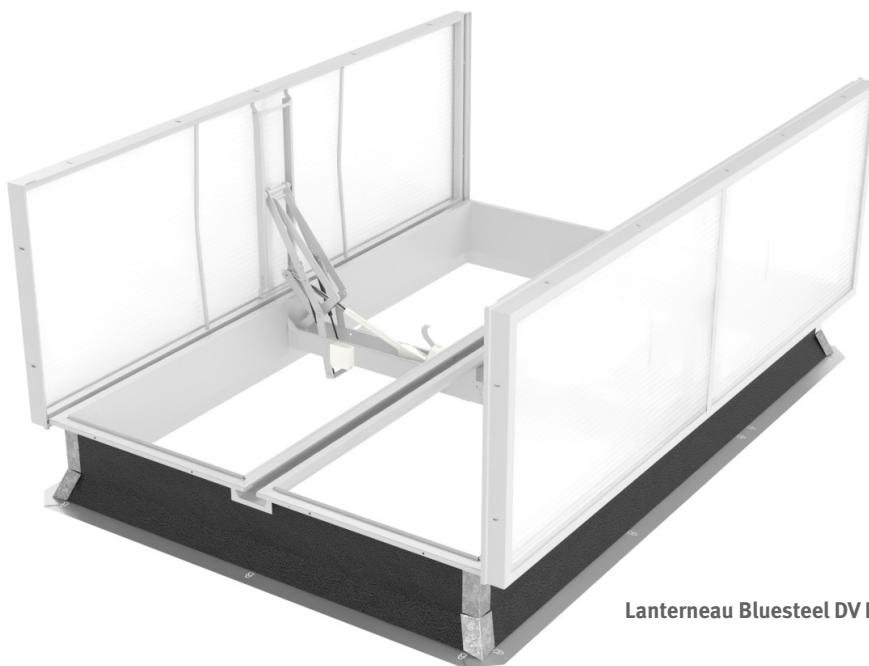
Lanterneau Bluesteel DV Elec pour toiture étanchée.

Les DENFC peuvent parer à toutes les conditions, mêmes les plus extrêmes, en étant conçus pour s'ouvrir même en cas de fortes charges de neige . Jusque-là, la gamme BLUETEK permettait de garantir l'ouverture du lanterneau, même si la neige s'accumule sur le remplissage, à un niveau d'altitude allant jusqu'à 800m.