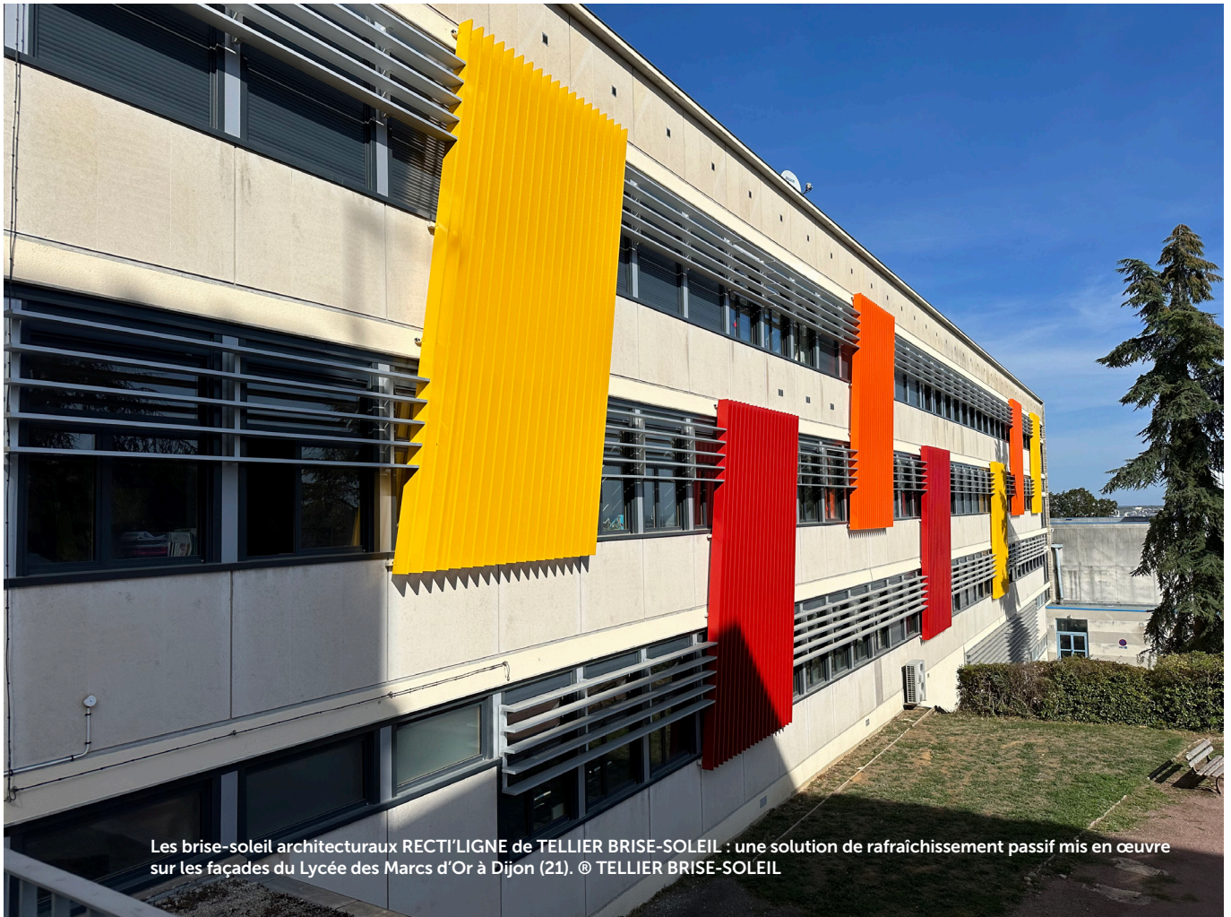
Les brise-soleil architecturaux RECTI'LIGNE de TELLIER BRISE-SOLEIL : une solution de rafraîchissement passif mise en œuvre sur les façades du Lycée des Marcs d'Or à Dijon (21).