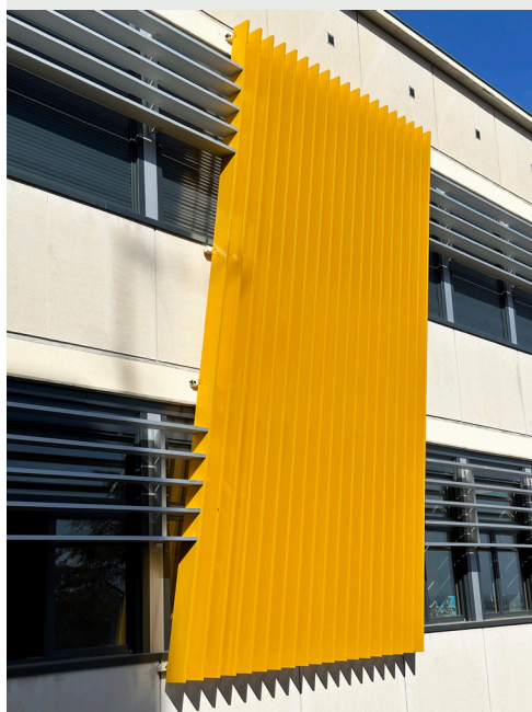
Centre des Congrès Robert-Schuman à METZ (57) / FAÇAD'LIGNE de TELLIER BRISE-SOLEIL posée sur ouvrants et imposte.

Cette solution se présente sous la forme de profils en aluminium extrudé équipés d'accessoires de fixations spécifiquement adaptés pour ce chantier. La finition des lames en trois coloris offre aux bâtiments un caractère unique et intemporel.