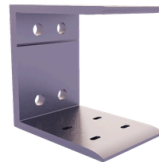
SpeedFix épaisseur 100 mm