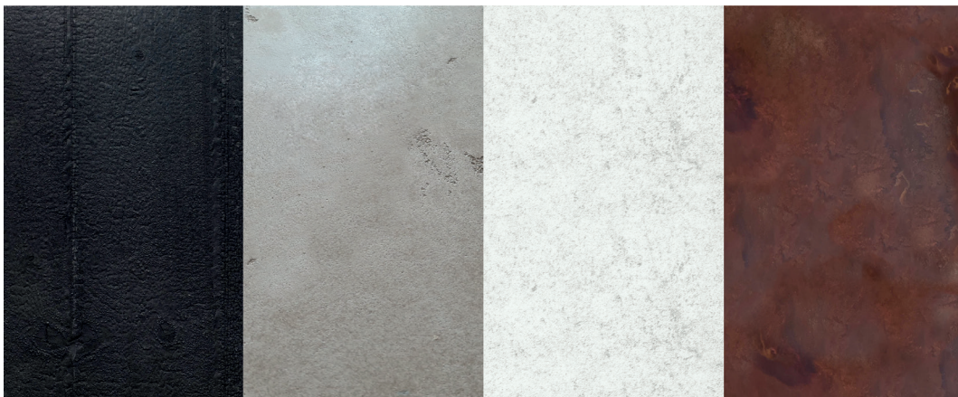
Finitions pour flan intérieur de porte d'entrée SIGNATURE (de gauche à droite) : bois brûlé, béton ciré, béton blanc, métal rouillé.

Ces finitions supplémentaires ont été imaginées pour créer un élément de décor pouvant s'harmoniser avec l'ambiance intérieure, voir faire le rappel du plan de travail de la cuisine avec sa finition en béton ciré dans un logement disposant de volumes totalement ouverts par exemple. La porte devient ainsi un véritable parement mural qui prolonge la décoration intérieure.