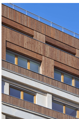
Réalisation de 28 logements sociaux à Saint-Herblain (44)

Parmi les projets récents, PROTAC a participé à la transformation d'un bâtiment de bureaux en logements dans le 14 e arrondissement de Paris. L'agence Pluriel(les) Architectes a choisi le bardage PROTAC , en douglas ignifugé "B-s1, d0", afin de réduire les déflecteurs et pour son esthétique, sa durabilité en environnement urbain et sa conformité aux exigences de la maîtrise d'ouvrage publique.