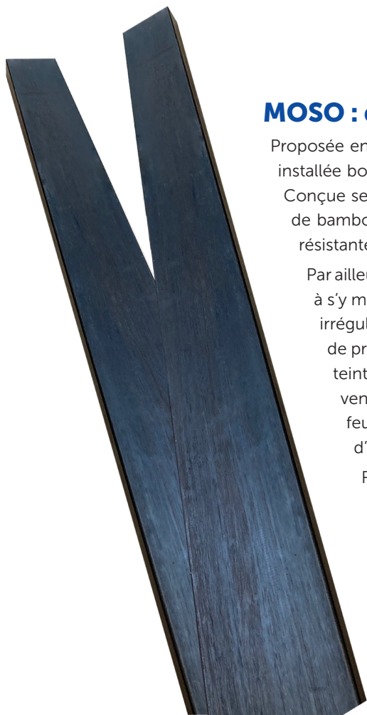
Lame MOSO composée de lamelles de bambou comprimées pour volets et claustras de TELLIER BRISE-SOLEIL.

Ressource renouvelable et matière première 100% recyclable, la lame MOSO est exclusivement dédiée aux brise-soleil fixes et aux cadres proposés par TELLIER BRISE-SOLEIL .