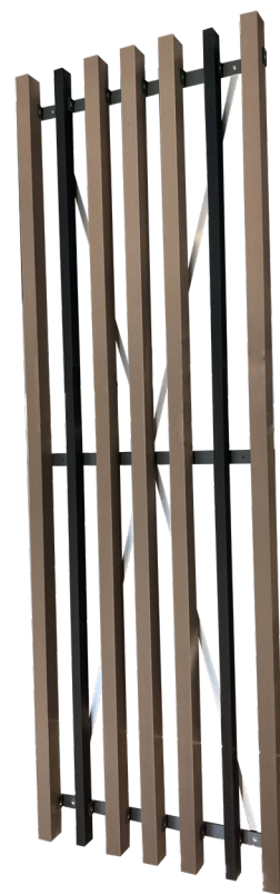
Profilé (existe aussi en lame) NEOLIFE pour brise-soleil fixes de TELLIER BRISE-SOLEIL.

TELLIER BRISE-SOLEIL , est l'unique spécialiste français de solutions de protection solaire, d'habillage des façades, d'occultation et de ventilation. L'ensemble des solutions du fabricant permet d'améliorer le bien-être des occupants à l'intérieur du bâtiment. Grâce à son offre globale et diversifiée, TELLIER BRISE-SOLEIL répond aux défis de la construction durable et de la rénovation énergétique.