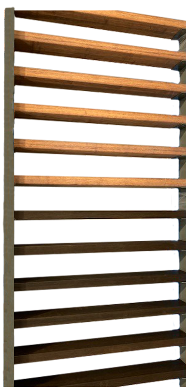
Lame MOSO pour volets et claustras de TELLIER BRISE-SOLEIL.