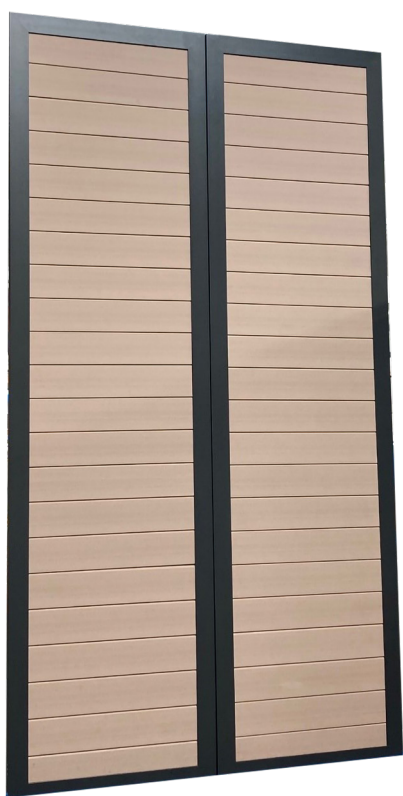
Lame LORYZA pour volets pliants-coulissants de TELLIER BRISE-SOLEIL.