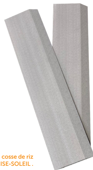
Lame LORYZA composée de PVC et de cosse de riz pour volets pliants-coulissants de TELLIER BRISE-SOLEIL.

Celle-ci est entièrement enveloppée de cosse de riz, matière première entièrement éco-responsable offrant un aspect 100% naturelle avec sa teinte brute unique. Matériau naturel exceptionnel par ses qualités intrinsèques, la cosse de riz dispose d'une parfaite imperméabilité et d'une extrême résistance aux conditions climatiques. Les lames LORYZA sont proposées en section de 30 x 160 mm et 24 x 160 mm (longueur sur mesure) et se destinent uniquement aux volets pliants-coulissants de TELLIER BRISE-SOLEIL .