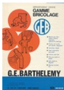
Affiche commerciale des premiers produits GEB vendus en quincaillerie (1945)