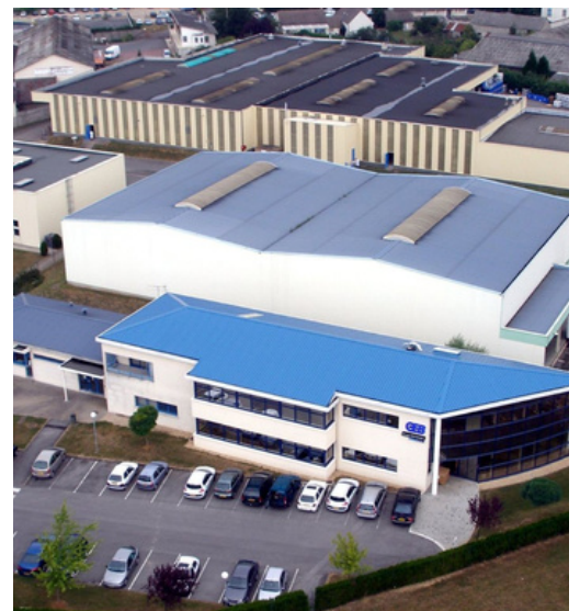
Site industriel de Nanteuil-le-Haudouin (60) comprenant 59 salariés répartis sur 32 000m 2

L'entreprise investit dans la formation et le développement des compétences, tant sur les dimensions techniques que sur les enjeux de qualité, de sécurité et de RSE.