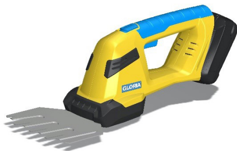
FINECUT 18V COMPACT avec lame À gazon fournie avec l'outil.

2-en-1, le FINECUT 18V COMPACT est proposé avec deux lames de coupe facilement interchangeables, sans outil spécifique ni graisse, pour s'adapter à de nombreuses applications.