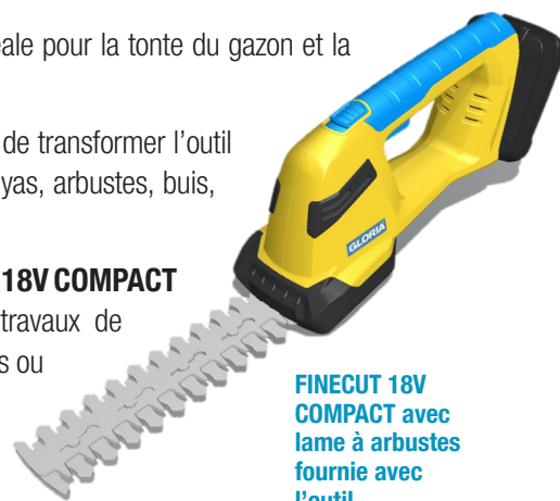
FINECUT 18V COMPACT avec lame à arbustes fournie avec l'outil.

Précis et léger (1,4 kg sans batterie), le FINECUT 18V COMPACT s'impose ainsi comme l'outil idéal pour les travaux de finition, la taille minutieuse de haies, de buissons ou de topiaires ainsi que la tonte de la pelouse.