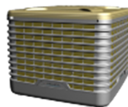
Adiabox WFP V3 31000

Par ailleurs, sur les zones de stockage et de production, 43 exutoires Bluesteel Therm , en version électrique, et quatre exutoires en acier Certilam T viennent renforcer l'évacuation des fumées, tandis qu'un écran de cantonnement SMOKE FIX de 176 mètres linéaires compartimente les volumes intérieurs pour sécuriser les voies d'évacuation.